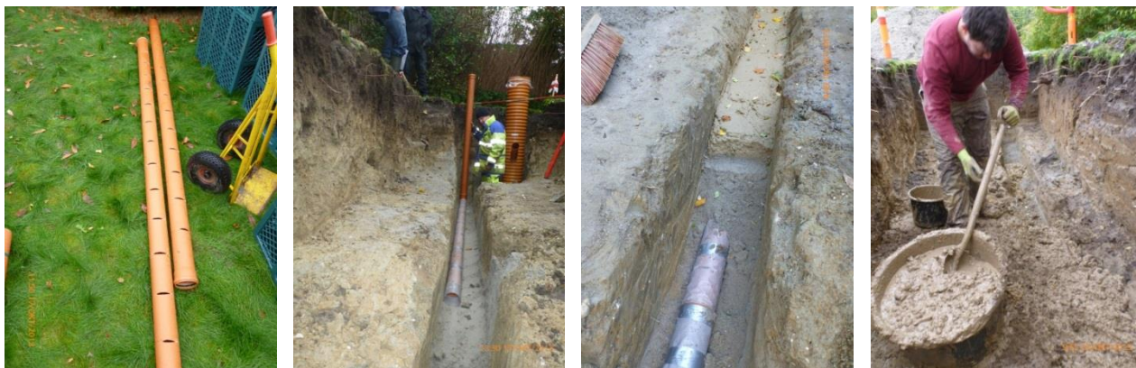
Foto: Nedlægning af opsamlingsrør til prøvetagning.

Før prøvetagning blev opsamlingsrøret og faskinens sandfang tømt for vand. Via pejlinger i pejle-røret blev sikret, at grundvandsstanden var min. ½ m under opsamlingsrøret. Efter næste regnskyl blev igen sikret, at grundvandsstanden forsat var min. ½ m under opsamlingsrøret, hvorved vandet i røret stammer fra faskinen. Der blev taget prøver fra sandfang (tilløb) og opsamlingsrør (afløb efter passage af ca. 25 cm reetableret moræneler samt afdækningssand). Efter coating af tagrender i sommeren 2014 blev tilløbsprøver taget i plastspande hængt lige under indløbet i sandfangene. Af uforklarlige årsager var der ikke vand i opsamlingsrøret i faskine 2 ved prøvetagning, hvorfor afløbsprøver fra faskine 2 måtte droppes. Analyser blev udført af akkrediterede miljølaboratorier.