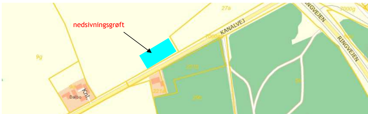
Beliggenhed af nedsivningsgrøft.